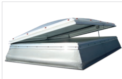
JET-TOP-90-SCHALL-Lichtkuppel geöffnet, mit Lüftungsmotor