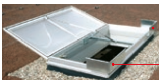
JET-RWA-Lichtkuppel mit Windleitführungen zur Optimierung des aerodynamischen Wirkungsgrades