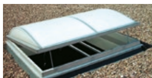
JET-VARIO-Lichtklappe mit RWA-Beschlag und E-Motoren in Lüftungsstellung