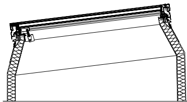
JET-SKYSIGHT auf JET-ISO-THERM-AK 7°