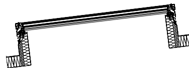
JET-SKYSIGHT auf JET-ISO-THERM-AK steil Einsatz bei ausreichender Dachneigung